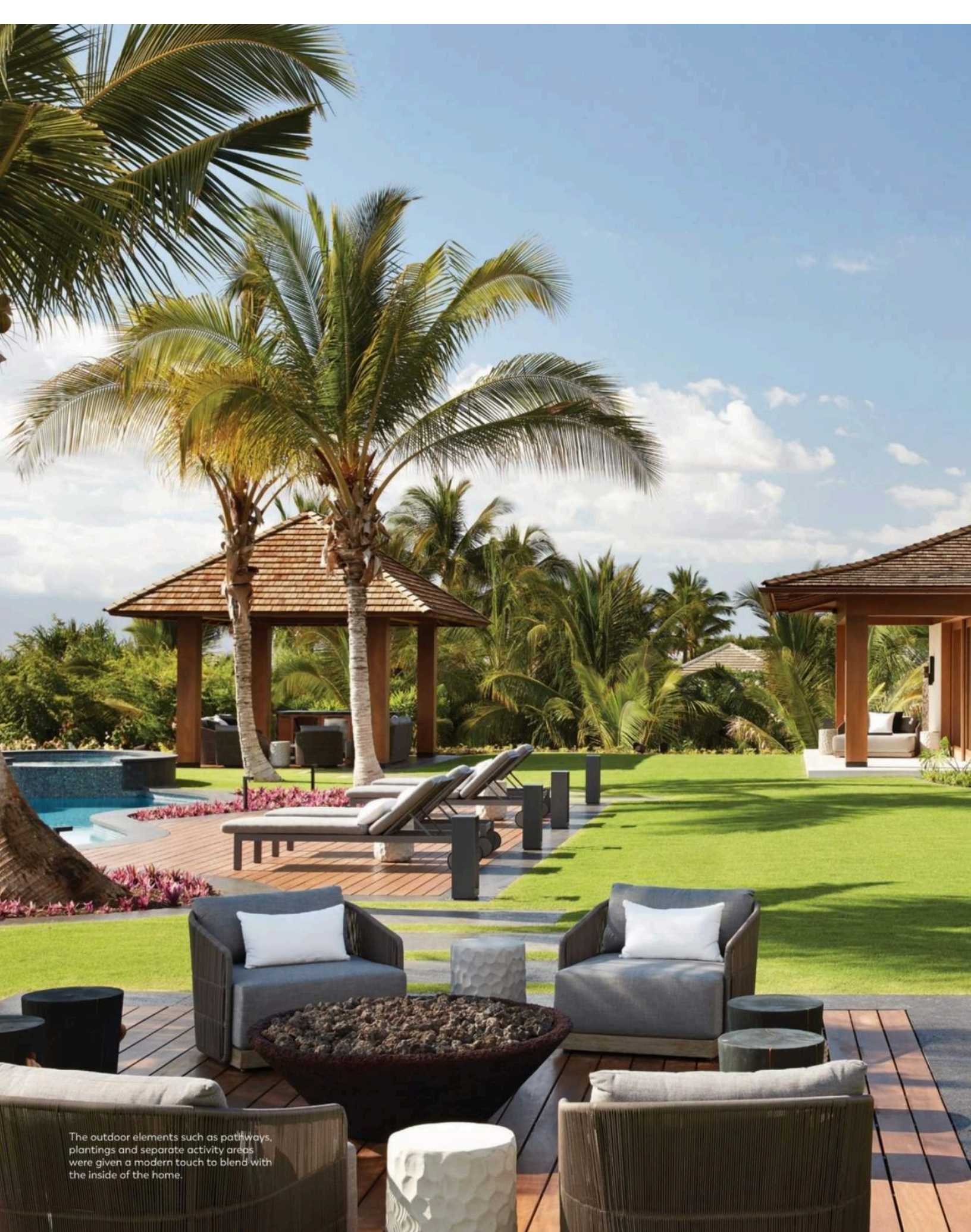
The outdoor elements such as pathways, plantings and separate activity areas were given a modern touch to blend with the inside of the home.